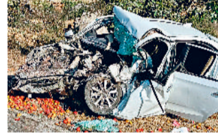
हरिभूमि न्यूज ▶▶ प्रतापपुर

कार और पिकअप के बीच मंगलवार की रात हुई भिड़ंत में चार युवकों की मौत हो गई। टक्कर इतनी जोरदार थी कि कार सवार तीन युवकों ने मौके पर ही दम तोड़ दिया जबकि चौथे युवक को अस्पताल में उपचार के दौरान मौत हुई। मरने वाले चार ▶▶ शोष पेज 2 पर