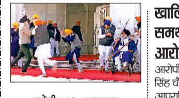
एजेसी ▶▶ अमृतसर

पंजाब के अमृतसर में स्वर्ण मंदिर के बाहर बुधवार को शिरोमणि अकाली दल (शिअर) के प्रमुख सुखबीर सिंह बादल पर एक पूर्व आतंकवादी ने गोली चलाई, लेकिन वहां सादे कपड़े में मौजूद एक पुलिसकर्मी द्वारा आरोपी को पकड़ लिए जाने से उसका निशाना चूक गया और बादल बाल-बाल बच गए। पंजाब में शिअर सरकार द्वारा 2007 से 2017 तक की गई 'गलतियों' के लिए स्वर्ण मंदिर में 'सेवादर' के रूप में बादल की सजा का यह दूसरा दिन था, जिसे 'कवर' करने पहुंचे मॉडियाकारियों के कैमरे में हमले का पूरा दृश्य 'रिकॉर्ड' हो गया। टेलीविजन पर प्रसारित दृश्यों में बादल (62) एक पैर की हड्डी टूटने की वजह से 'व्हीलचेयर' पर बैठकर सेवा करते दिखते हैं।