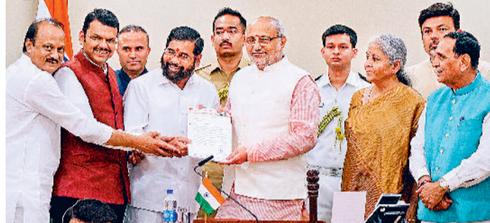
शिवसेना नेता देवेंद्र फडणवीस ने कहा कि शिवसेना नेता एकनाथ शिंदे का आभार व्यक्त करता हूँ कि उन्होंने मुख्यमंत्री पद के लिए मेरे नाम का समर्थन किया है। एनसीपी नेता अजित पवार ने भी मेरे नाम की सिफारिश की।

एजेसी ▶▶ मुंबई विधान भवन में हुई विधायक दल की बैठक में गुजरात के पूर्व मुख्यमंत्री एवं भाजपा के केंद्रीय पर्यवेक्षक विजय रूपाणी ने घोषणा की कि फडणवीस (54) को सर्वसम्मति से भाजपा विधायक दल का नेता चुना गया है। बैठक में भाजपा की केंद्रीय पर्यवेक्षक एवं केंद्रीय मंत्री निर्मला सीतारमण ने कहा कि राज्य और केंद्र में 'डबल इंजन की सरकार' विकास को बढ़ावा देगी।